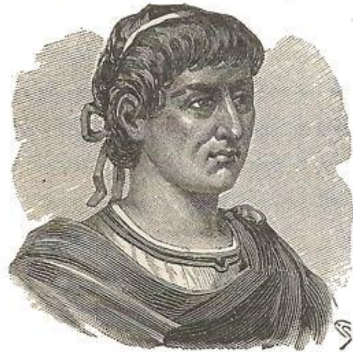
Vitruvio Marco Pollione.